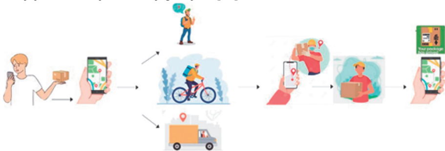
Slika 4. Prikaz funkcionisanja Crowdsourced dostave [17]

Za razliku od profesionalnih kurira, crowdsourced dostavljači nisu nužno profesionalci, već su voljni da, uz nadoknadu, obavljaju dostavu dok se kreću gradom (najčešće svojim automobilom). Iako dostava može biti deo njihovog redovnog kretanja, često se angažuju i oni koji imaju slobodno vreme ili žele dodatni prihod. Ovaj model donosi niže operativne troškove i smanjuje potrebu za skladišnim kapacitetima zahvaljujući ubrzanom distribuciji pošiljaka [18].