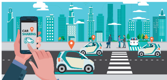
Slika 2. Ilustrativni prikaz funkcionisanja deljenja vozila [12]

ilustrativni prikaz funkcionisanja deljenja vozila. U tom smislu, platforme poput Getaround ili Zipcar mogu biti korišćene za kratkoročno iznajmljivanje vozila za dostavu na poslednjoj milji (engl. lastmile delivery ).