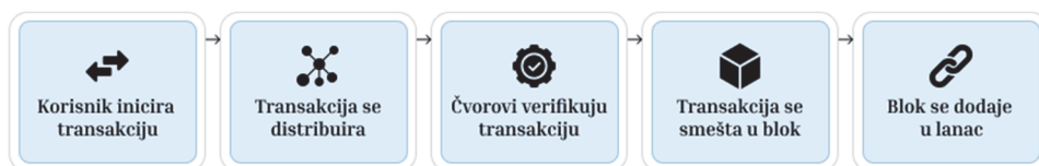
Slika 1. Princip rada blokčejn tehnologije

Identitet korisnika je određen kombinacijom javnog i privatnog ključa, koji se pored identifikacije koriste i za potpisivanje obavljenih transakcija. Kada korisnik inicira transakciju, njen sadržaj se šifruje hešing ( hashing ) funkcijom, čiji je izlaz jedinstveni heksadecimalni zapis - heš ( hash ). Šifrovani podaci se dalje potpisuju pomenutim parom ključeva, pri čemu tzv. digitalni potpis jednoznačno povezuje transakciju sa korisnikom. Transakcija zatim postaje vidljiva svim čvorovima mreže, koji tada mogu započeti proces verifikacije. Da bi potvrdili ispravnost, potrebno je da su poreklo i sadržaj transakcije nepromenjeni, što će potvrditi nepromenjenost heš vrednosti i digitalnog potpisa. Validne transakcije se smeštaju u blok, čiji se sadržaj takođe hešuje. Svaki blok je obeležen svojim, i hešom prethodnog bloka. Na taj način se stvara "neraskidiv" lanac blokova čiji se sadržaj više ne može promeniti [4]. Ovaj princip dodatno je ilustrovan Slikom 1.