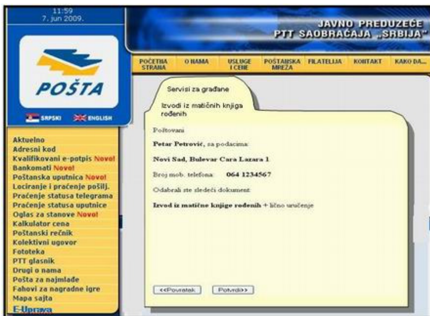
Slika 5. Web stranica provere unetih podataka korisnika

Nakon provere korisnik potvrđuje zahtev klikom na opciju Potvrđujem.