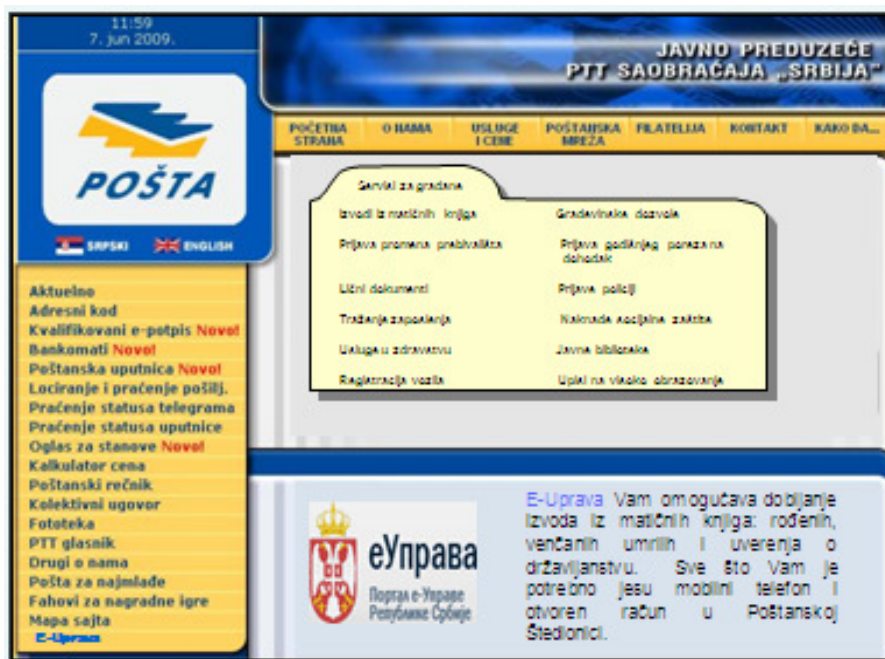
Slika 3. Web stranica sa 12 osnovnih servisa e-Uprave za građane

Na sledećoj slici prikazano je 12 osnovnih servisa e-Uprave koji predstavljaju servise za građane.