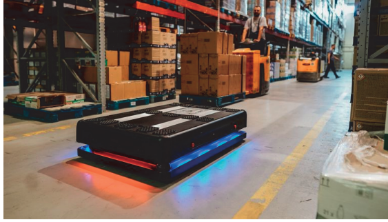
Slika 4. Autonomni mobilni roboti u skladištima [17]