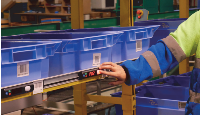
Slika 2. Pick to light u skladištu [11]

Pick to Light zasloni zamjenjuju uobičajene liste za brzo i jednostavno izdvajanje proizvoda za određenog kupca, tj. dostavno mjesto. Pored navođenja distributera za određenu lokaciju, zasloni precizno pokazuju i naručenu količinu te zahtijevaju potvrdu za svaki uzeti proizvod [6].