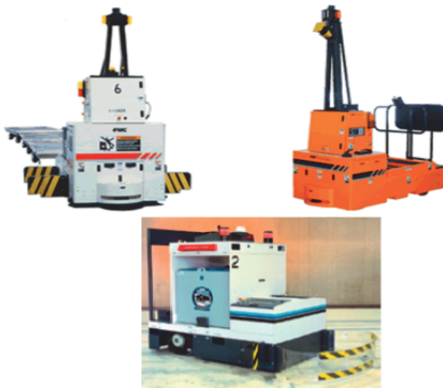
Slika 3. AGV vučna vozila [14]

Automatski vođena vozila za prijevoz jediničnih tereta vozila s utovarnim prostorom je također vrsta vozila koja služi za transport robe koja se utovara na postolje koje se nalazi na vozilu i prevozi se. Ova vozila nazivaju se i vozila jediničnih tereta (palete, kutije, pojedinačni komadi), a najčešće imaju i automatski pretovar (pomoću podiznog stola, lančanog, trakastog ili valjčanog konvejerera). Primjenjuju se kod transporta na kraće udaljenosti visokim protokom, a zbog sposobnosti automatskog povezivanja s konvejerima, radnim stanicama, strojevima i AS/RS sistemima često su integrirani u automatizirani proizvodni ili skladišni sistem [14]. Usvajanjem automatizovanih sistema, skladišta mogu: smanjiti ljudsku grešku, minimizirati rad, poboljšati koordinaciju rukovanja materijalom, poboljšati sigurnost na radnom mjestu, povećati kontrolu zaliha, poboljšati korisničku uslugu [15].